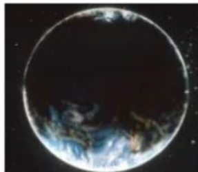
Graphic of Earth entombed by radioactive dustclouds after nuclear use

... humanity faces extinction if we do not pull back from the insane military-industrial growth and dominance of our lives and economies.